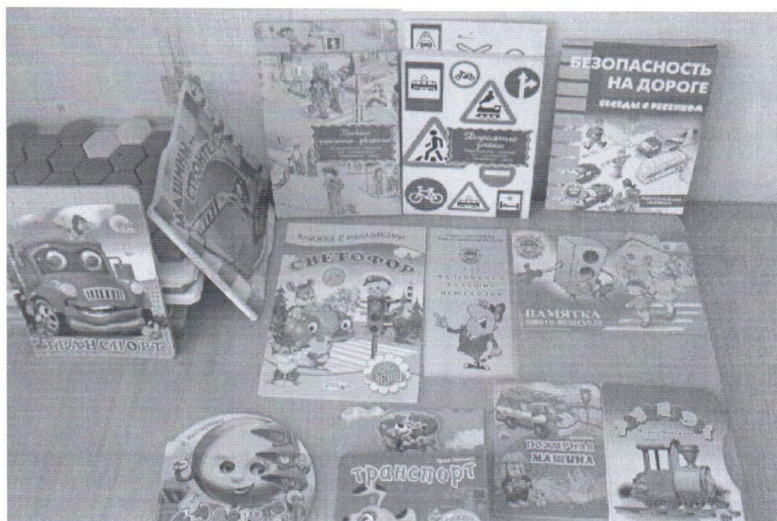
Выставка детской литературы в рамках проекта «Безопасность это важно»