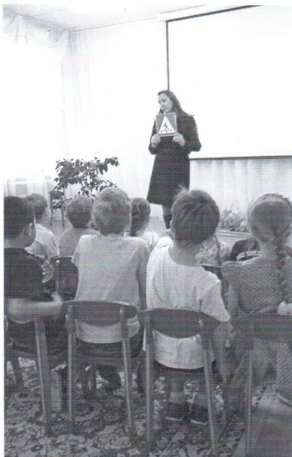
Знакомство детей с дорожными знаками