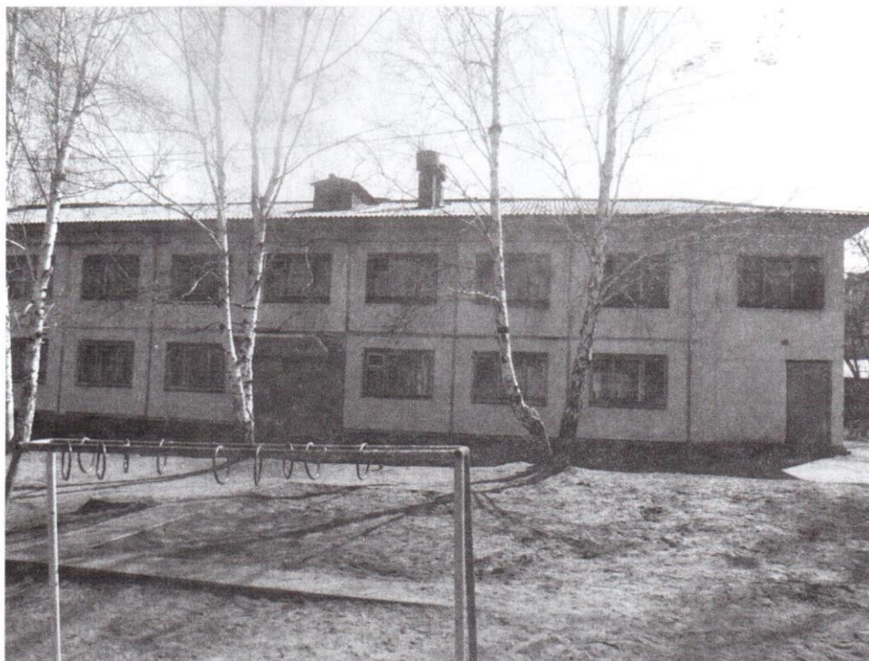
Фото № 4,5