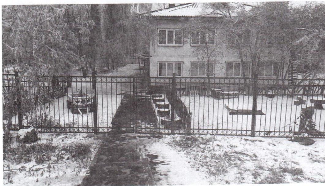
Пути движения к объекту