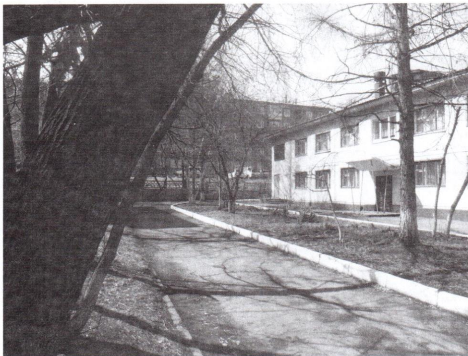
Фото № 2,3