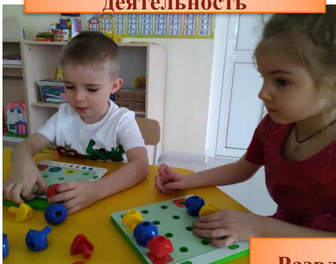
Развлечения и викторины