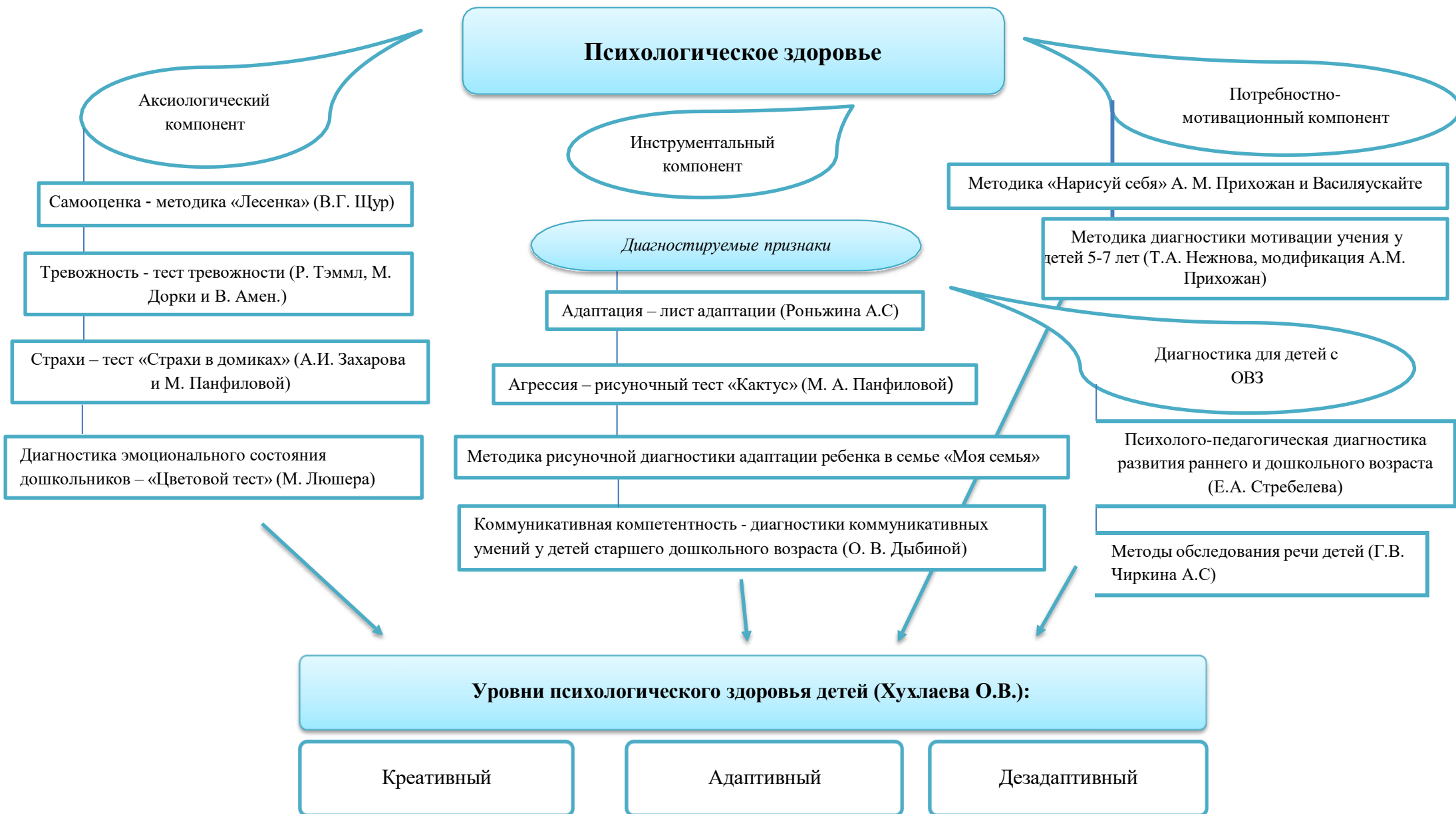
Схема модели создания благоприятных условий, способствующих сохранению и укреплению психологического здоровья детей раннего и дошкольного возраста, в том числе детей с ОВЗ