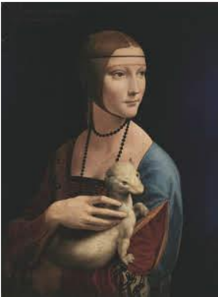
1. ДАМА С ГОРНОСТАЕМ. 1483 год. Леонардо да Винчи.