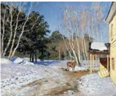
3. МАРТ. 1895 год. И. Левитан.