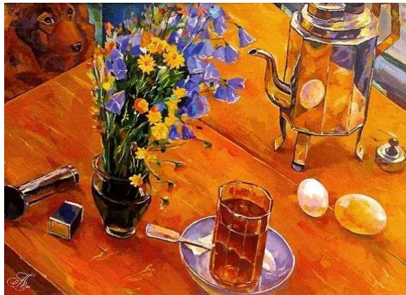
2. 1918 год. Петров-Водкин.