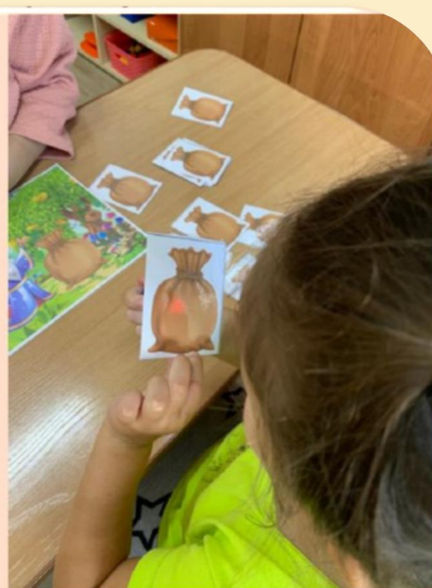
У волШебника в меШке коШка...