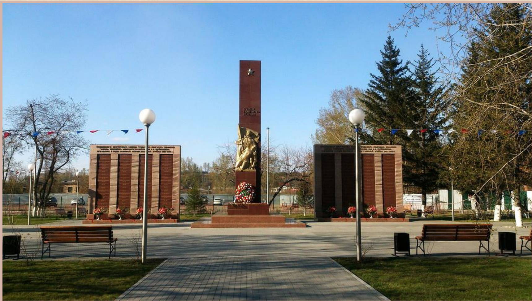
Мемориал памяти погибших воинов-заводчан — сквер «Иркутск-Сити», район «Иркутск-Сити», проспект Большой Литейный