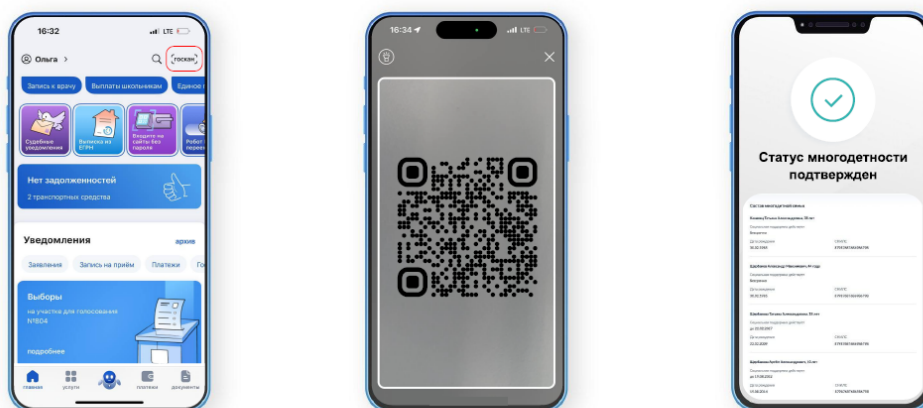
Рис. 3 – Экран проверяющего.

2.4. При успешно выполненной проверке, указанной в пункте 2.3, проверяющий принимает положительное решение о предоставлении услуги.