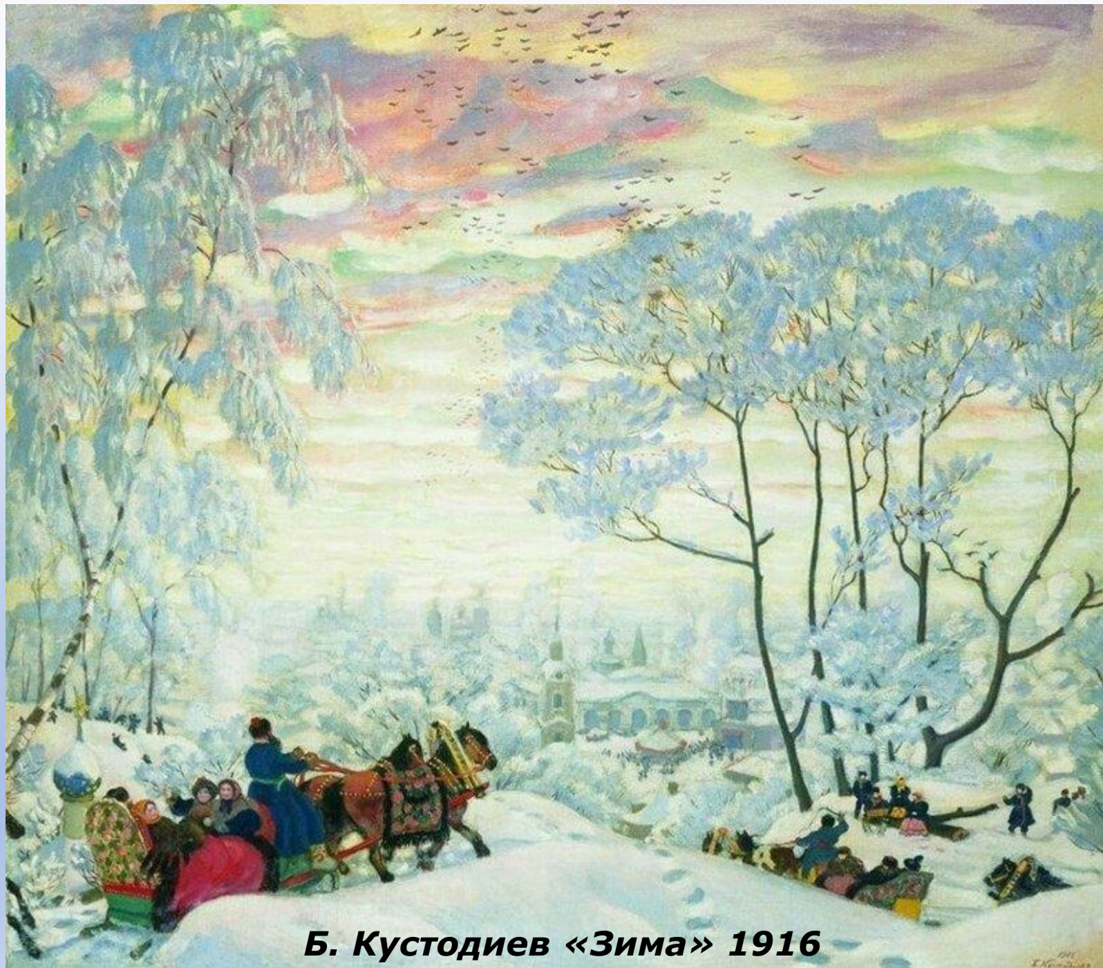
Б. Кустодиев «Зима» 1916

Наконец-то мы с полным правом можем сказать, что наступила настоящая зима! Если у кого-то все еще оставались сомнения, то сегодня календарь их окончательно развеет. И как бы мы ни относились к нашей суровой зимушке, надо признать – она действительно красавица!