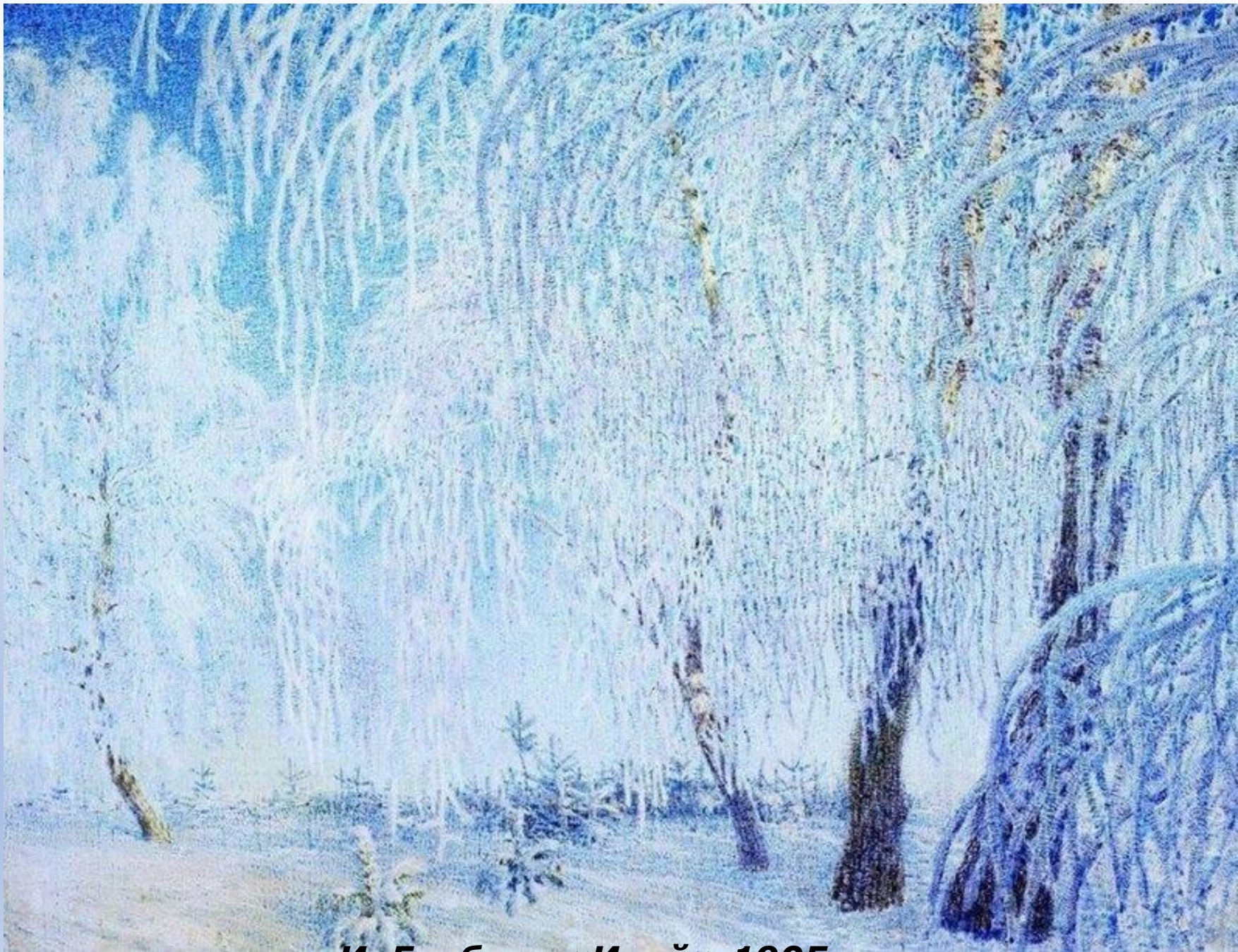
И. Грабарь «Иней» 1905

А излюбленной зимней темой творчества Игоря Грабаря стал... иней. Художника занимала задача - как передать эти сказочные мгновения, как передать кристаллическую природу инея и изменчивые краски природы. Его восхищала игра лучей солнца в ледяных кристаллах. Вот что Грабарь сам писал об этом: «Видел его, конечно и прежде, но не как художник, а как обыватель, теперь же я впился глазами в это необычайное, фантастическое зрелище, в эту сказку в действительности».