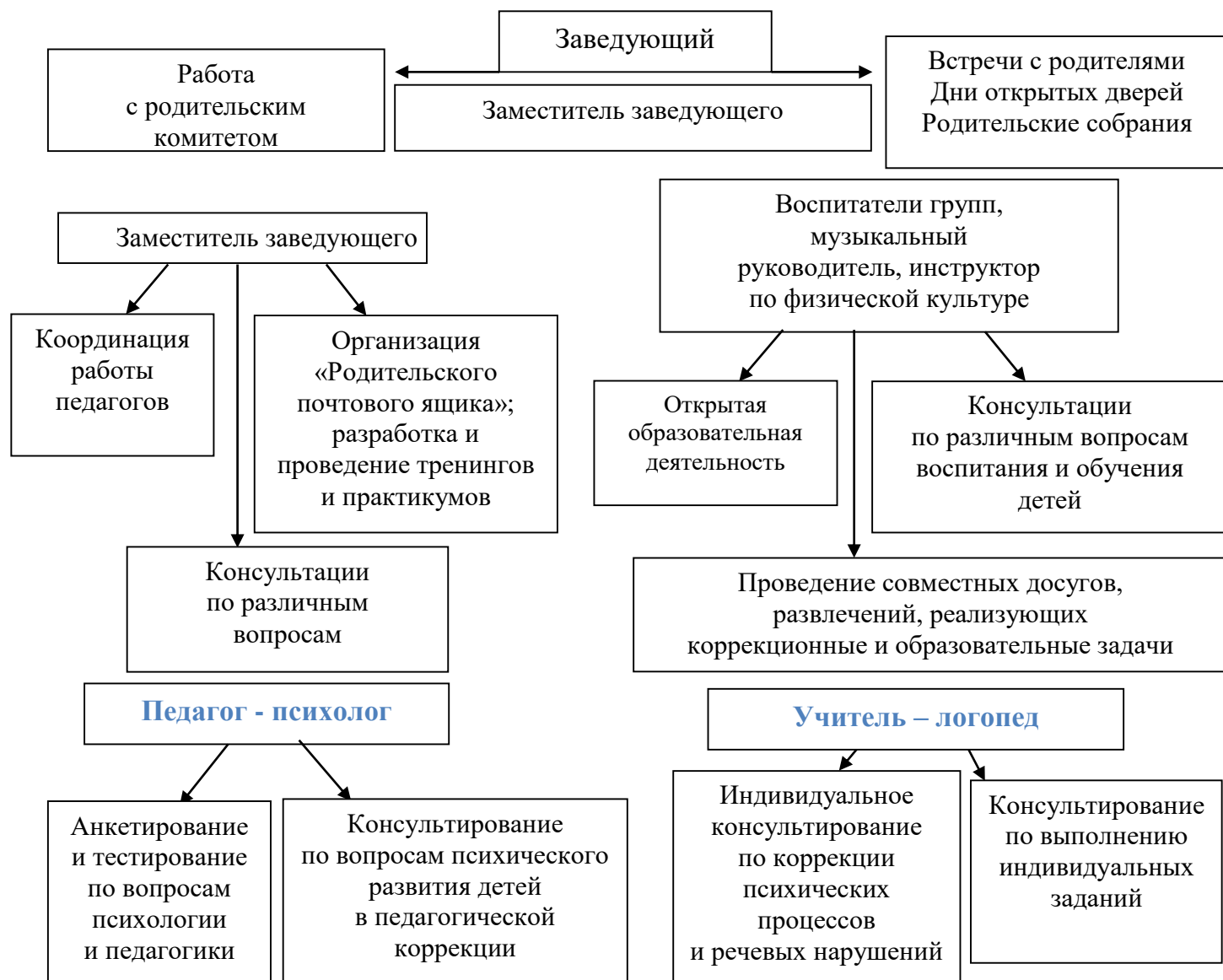
Рис. 1 «Схема взаимодействия с семьями воспитанников»