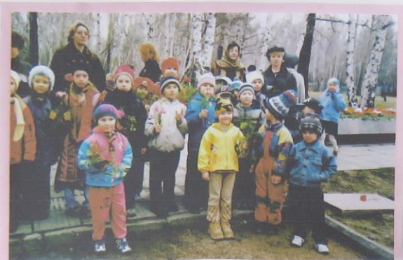
Памяти павших – будем достойны...