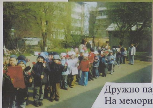
Дружно парами идём На мемориал цветы несём!