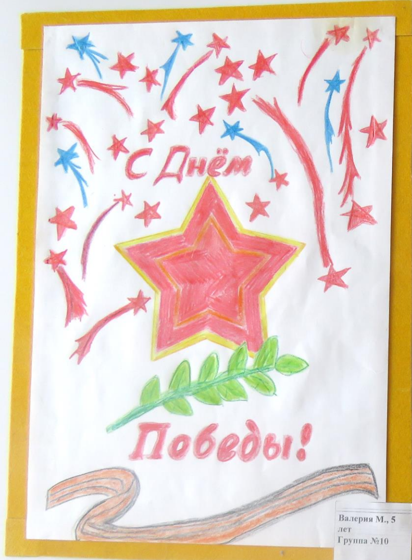
Валерия М., 5 лет Группа №10