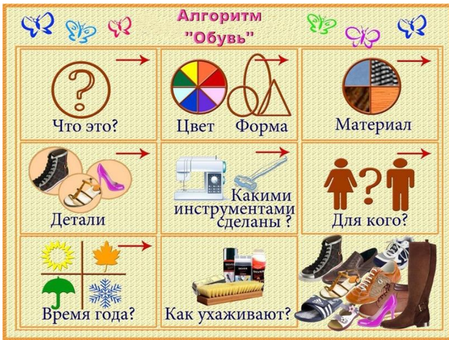
Схема описания «Обувь»