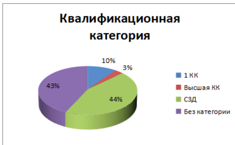
Рис.3. Категорийность педагогов

Из диаграммы следует, что 4 педагога имеют первую квалификационную категорию, и 1 – высшую квалификационную категорию, что составляет 13,3% от общего числа педагогов.