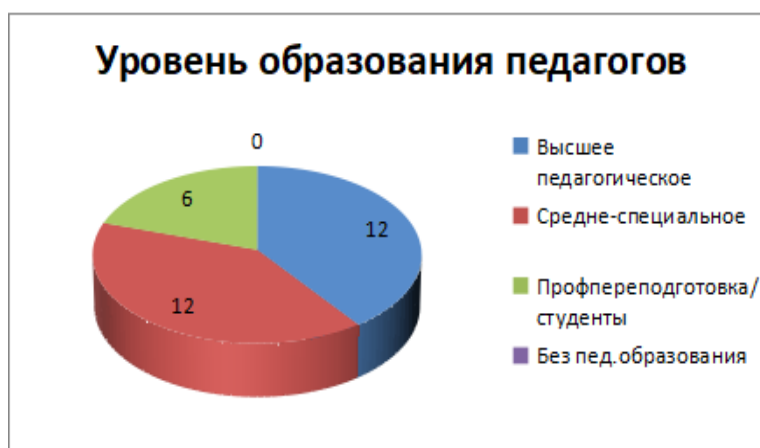
Рис.1. Уровень образования педагогов