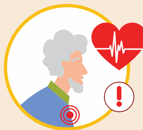
ВЫЗЫВАЕТ СЕРЬЕЗНЫЕ ОСЛОЖНЕНИЯ