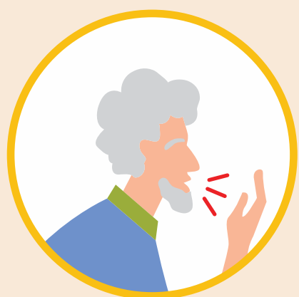
ГРИПП ОЧЕНЬ ЗАРАЗЕН