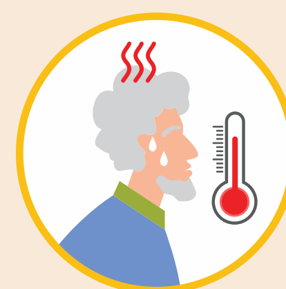
ПРОТЕКАЕТ НАМНОГО ТЯЖЕЛЕЕ ДРУГИХ ОРВИ

ОПТИМАЛЬНОЕ ВРЕМЯ ДЛЯ ВАКЦИНАЦИИ – СЕНТЯБРЬ – НОЯБРЬ.