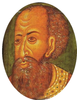
Царь Иван IV Грозный