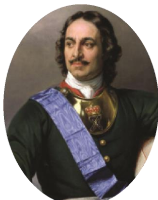
Император Петр I

целярия во главе с графом П.А. Толстым. И работала она на совесть. Но были и такие дворяне и чиновники, которые к проблеме мздоимства относились гораздо терпимее. По рассказам современников, однажды в Сенате Петр пригрозил издать указ, по которому всякий, кто украдет у казны сумму, на которую можно купить веревку, будет повешен. Генерал-прокурор Ягужинский на это заметил: «Неужели вы хотите остаться императором без служителей и подданных? Мы все ворует — с тем толь-