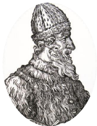
Великий князь Иван III

Петром I были введены в действие указы «О воспрещении взяток и посулов»,