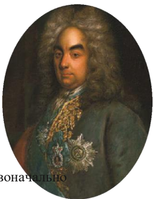
Петр Андреевич Толстой