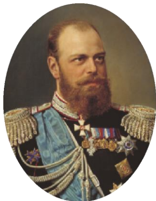
Император Александр III