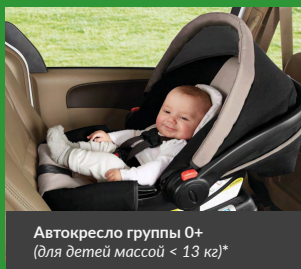
Автокресло группы 0+ (для детей массой < 13 кг)*