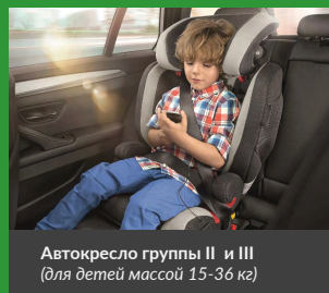
Автокресло группы II и III (для детей массой 15-36 кг)