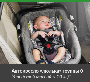
Автокресло «люлька» группы 0 (для детей массой < 10 кг)*

При покупке детского удерживающего устройства обязательно следует уточнить у продавца наличие сертификата на товар!