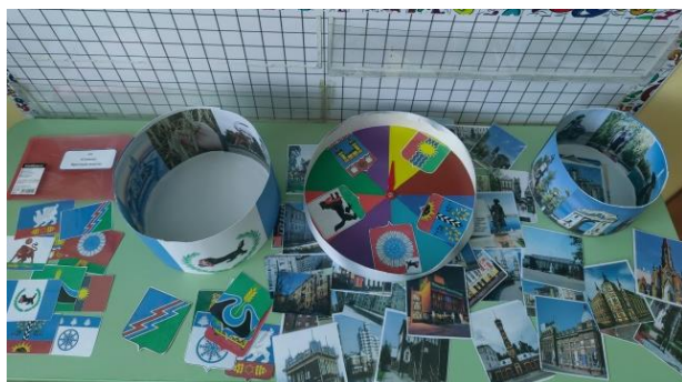
Моя Малая Родина (область, город)

Дидактическая игра способствует возникновению и поддержанию интереса у детей старшего дошкольного возраста к истории страны, родного края и города, государственной символике, культуре, традициям России .