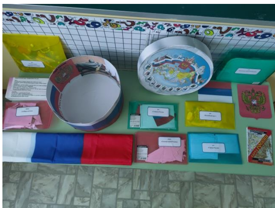
Моя Родина- Россия