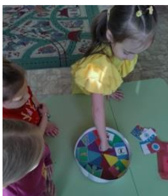
Игра «Вертушка» (найди правильно)

Задачи игры : знакомство детей с символикой г.Иркутска, воспитывать гордость за свой родной город.