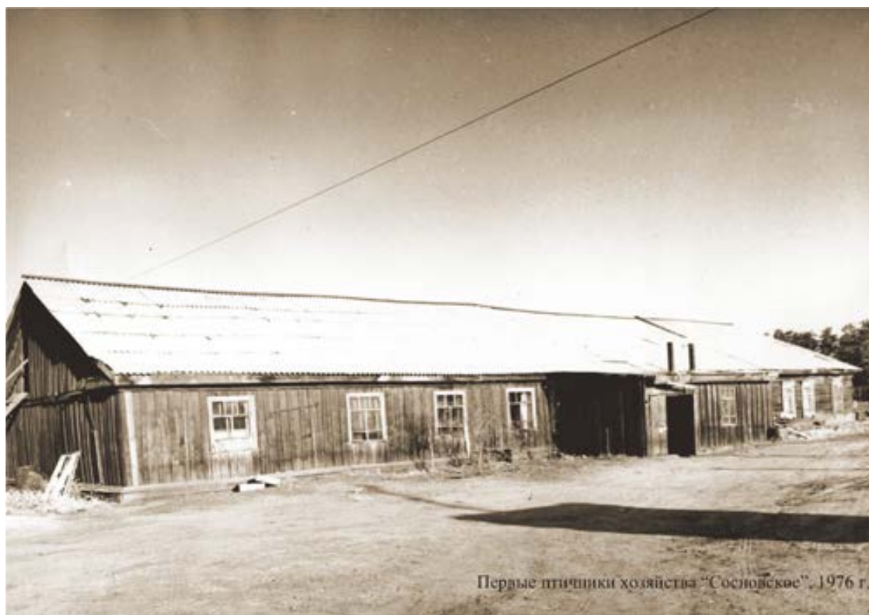
Первые птичники хозяйства "Сосновское", 1976 г.

Его основная специализация заключалась в производстве яйца куриного, мяса свинины, овощей.