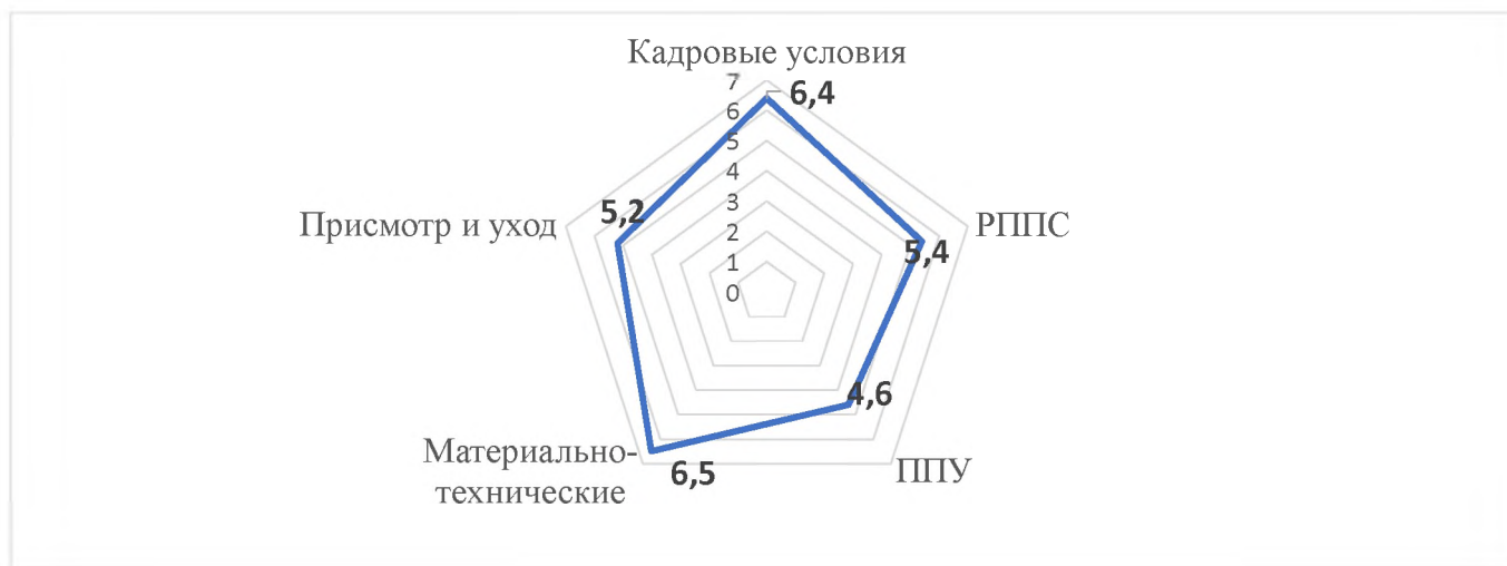
Общие данные по направлениям

Максимально возможный показатель 7 баллов. 3 балла - допустимый показатель, 4-5 баллов- хороший показатель. По сравнению с результатами 2022-2023 учебного года, некоторые результаты улучшились. Данные представлены в таблице: