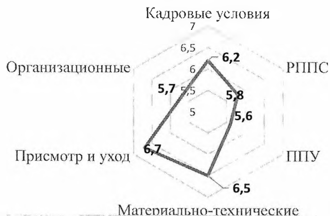
Общие данные по направлениям

Максимально возможный показатель 7 баллов. 3 балла - допустимый показатель, 4-5 баллов- хороший показатель. По сравнению с результатами 2023-2024 учебного года, некоторые результаты улучшились. Данные представлены в таблице: