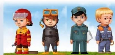
Памятка по пожарной безопасности для родителей и детей

НЕ ОСТАВЛЯЙТЕ БЕЗ ПРИСМОТРА КОСТЁР, ОСОБЕННО В ВЕТРЕННУЮ ПОГОДУ. УХОДЯ ИЗ ЛЕСА, ЗАТУШИТЕ КОСТЁР, ЗАЛЕЙТЕ ЕГО ВОДОЙ ИЛИ ПРИСЫПЬТЕ ЗЕМЛЁЙ.