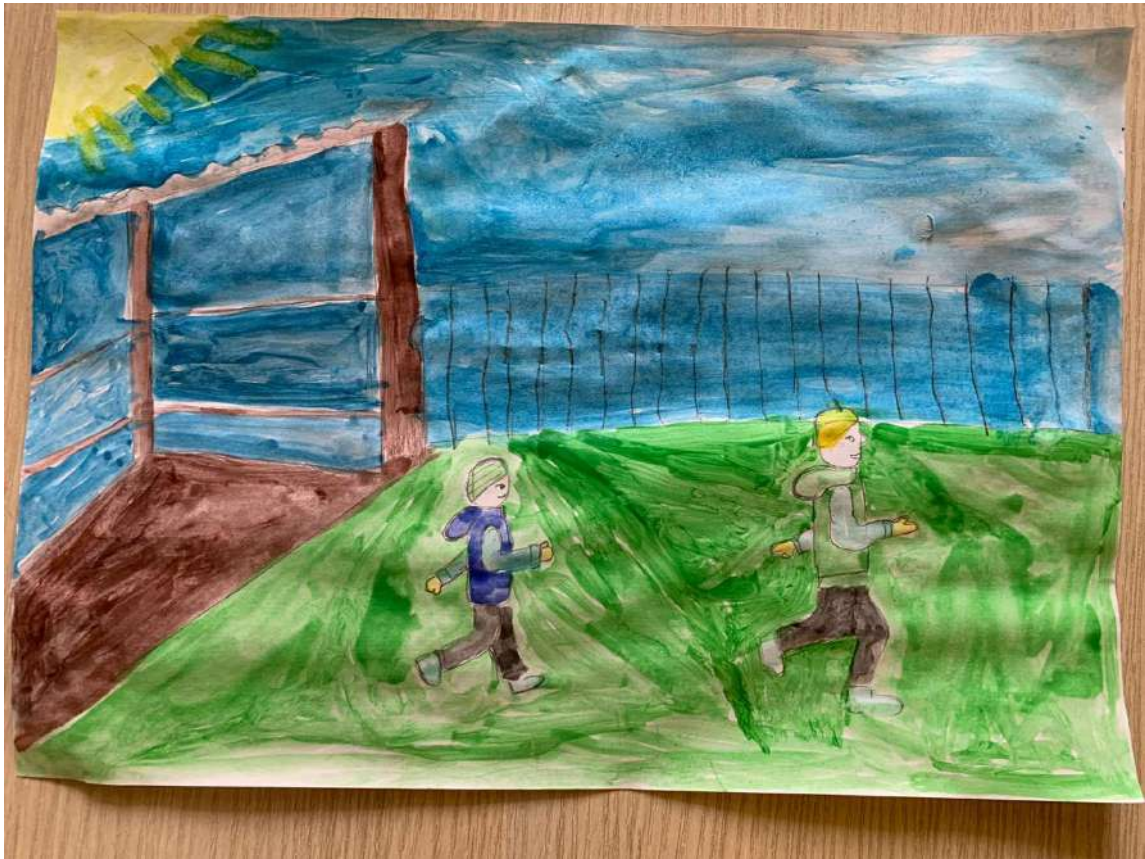
Блихарский Максим " На утренней пробежке"