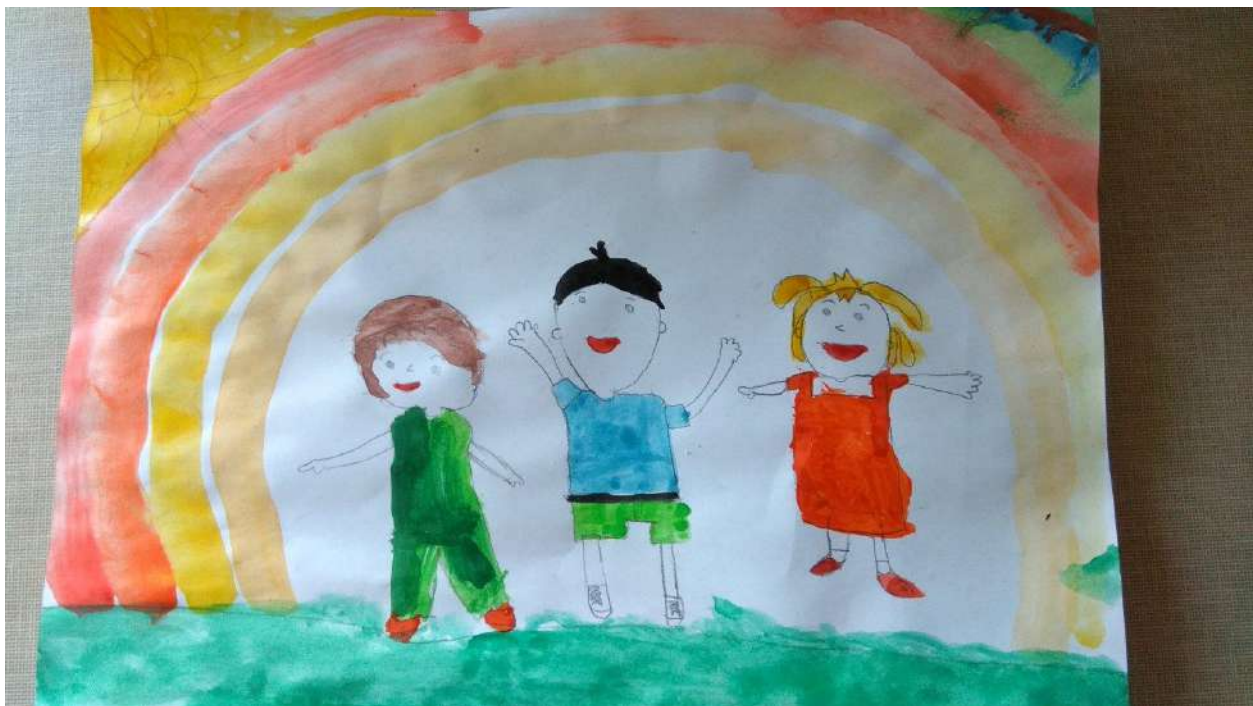
Шевень Аня "Друзья - это всегда радость!"