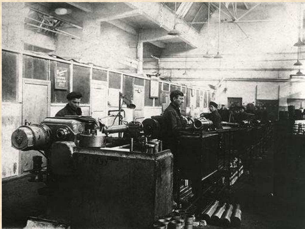
Заводской цех Иркутского авиационного завода во время Великой Отечественной войны.

До начала войны Иркутск процветал и по праву считался одним из самых крупным городов Сибири. Он славился своим заводом тяжелого машиностроения имени Куйбышева и авиационным заводом. Однако гудели здесь станки и множества других предприятий: механического, кожевенного, мыловаренного, комбикормового и ликероводочного заводов, слюдяной, чаепрессовочной, макаронной и меховой фабрики, а также крупнейшего на востоке Сибири мясокомбината.