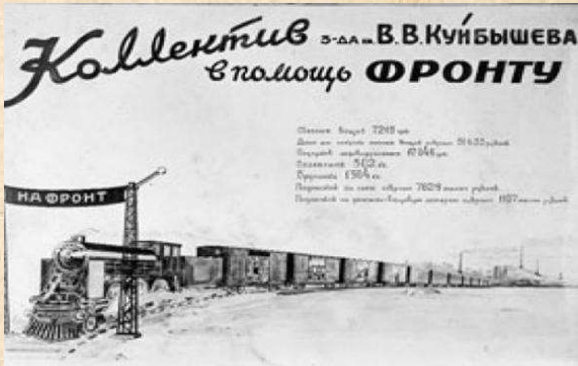
Коллектив завода тяжелого машиностроения имени Куйбышева помогал фронту чем мог: и одеждой, и пельменями, и брусникой.

На завод тяжелого машиностроения имени Куйбышева прибыло оборудование и кадры с Ново- и Старокраматорского машиностроительных заводов с Украины. Правда, монтаж станков занял очень много времени и первая продукция из-под них вышла лишь в середине 1942 года. Часть эвакуированных рабочих и служащих временно остались в вагонах, другие расселились в заводских домах за счет уплотнения жителей.