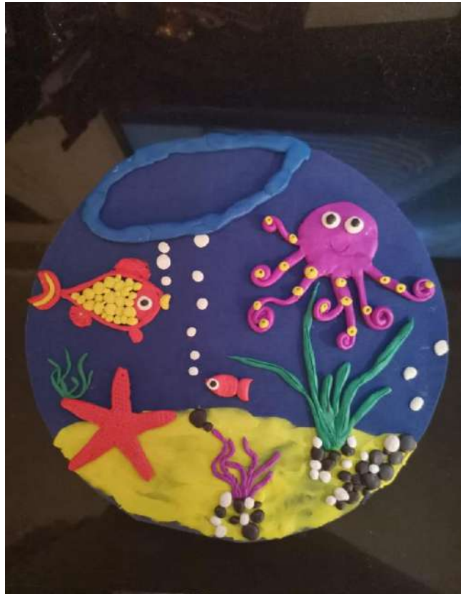
Мичкань Степан "Этот сказочный подводный мир"