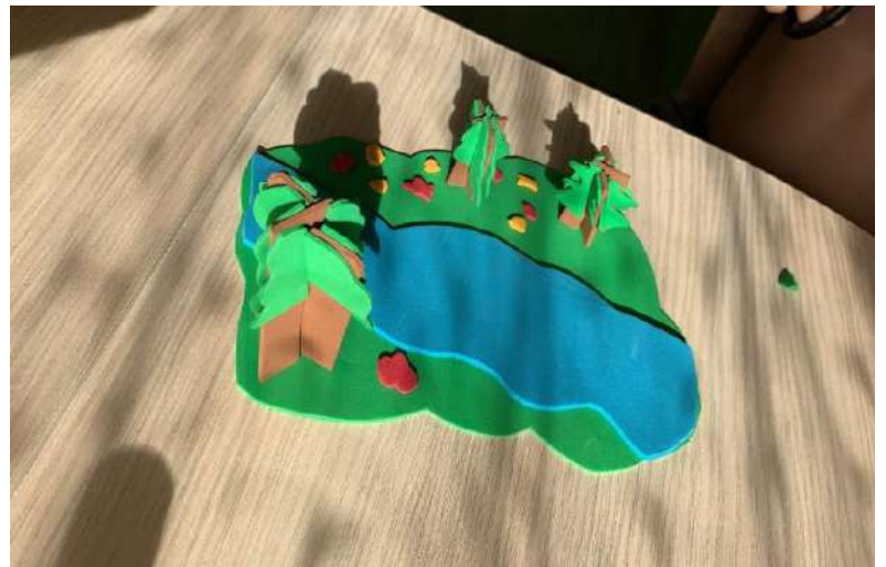
Блихарский Максим "Вода в природе - это ещё и красота!"