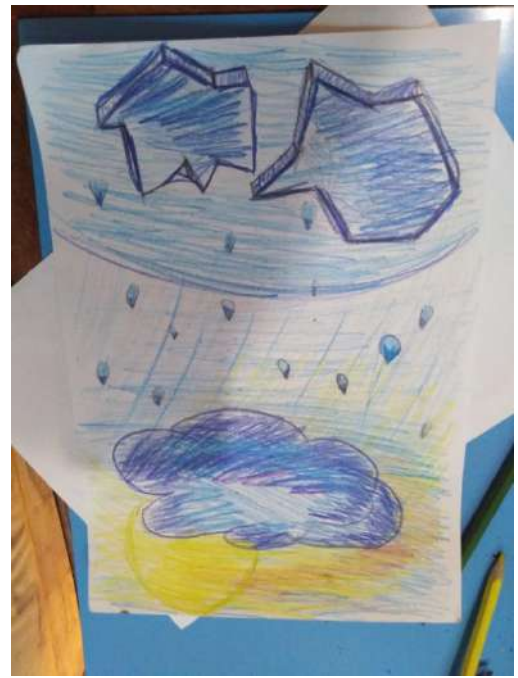
Музофаров Роман " Пасмурная погодка"