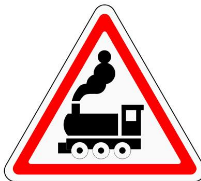
ЖД переезд без шлагбаума