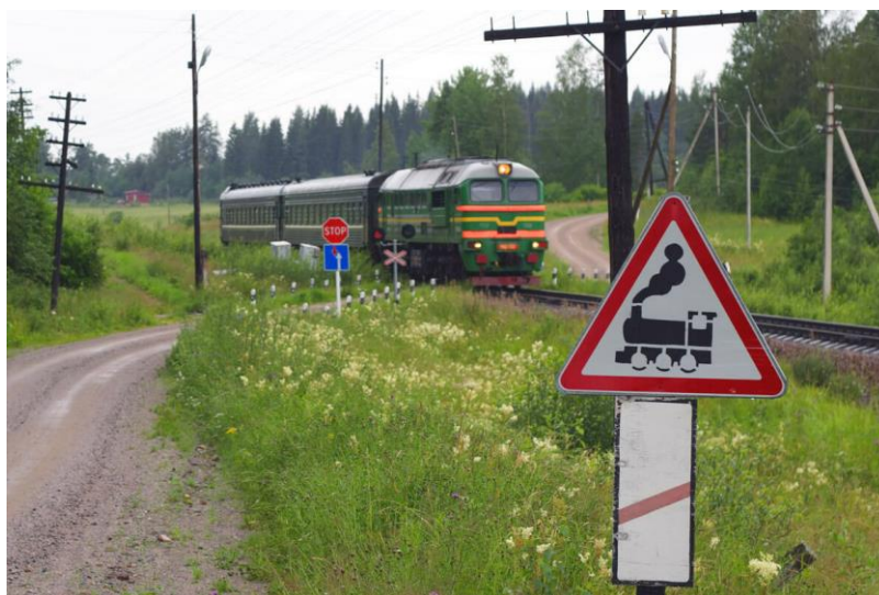
Электричка и знак переезда

Если же на знаке вместо заборчика изображен локомотив, то такой переход будет нерегулируемый. К нему стоит относиться с особой осторожностью и не терять бдительности при пересечении полотна.