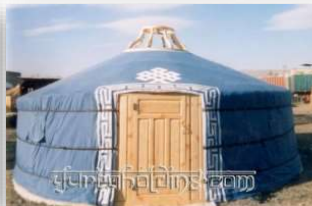
Современный дизайн юрты