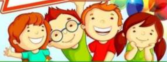
Фото и видео съемка может быть произведена только со своего места.

Излишняя фото- и видеосъемка отвлекает детей, поэтому не следует ходить по залу с кинокамерой или фотоаппаратом, делать ребенку жесты, мешая ему и другим детям наслаждаться праздником и нарушать праздничный настрой.