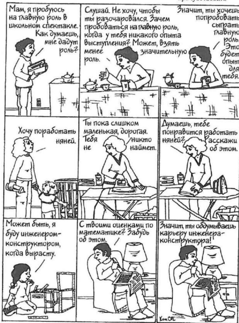
Стараясь оградить ребенка от разочарования, мы лишаем его надежды, стремления и иногда воплощения мечты

дайте ему самому все выяснить и почувствовать