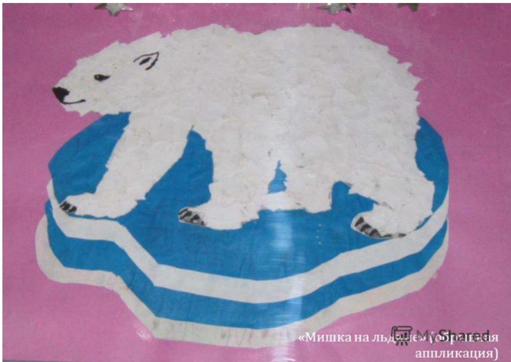
«Мишка на льдине» (сборная апликация)