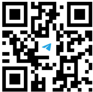
График обследования детей на ТПМПК г. Иркутска

Считайте этот QR-код для входа в наш Telegram-бот