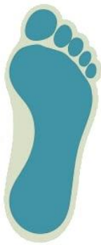
Плоскостопие I степени