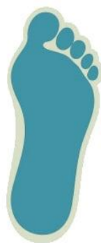
Плоскостопие II степени