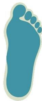
Плоскостопие III степени