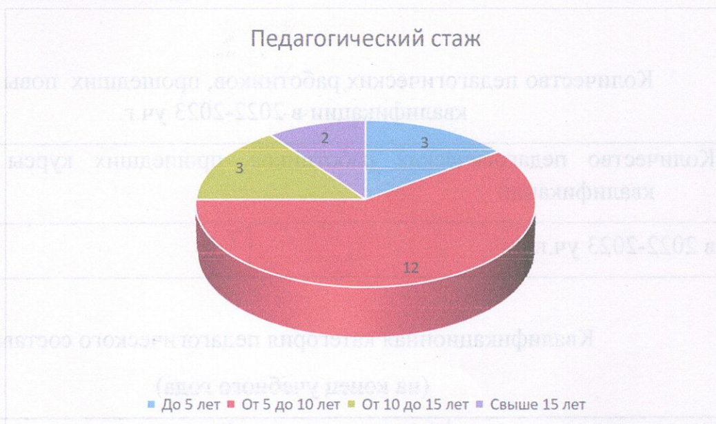
Рис.2. Педагогический стаж

Следовательно, педагогический коллектив МБДОУ детский сад № 95 стабильный. Количественный и качественный состав педагогов за прошедший учебный год практически не менялся. Большинство педагогов имеют специальное образование и опыт работы. При этом достаточный профессиональный уровень педагогов позволяет решать задачи воспитания и развития каждого ребенка.