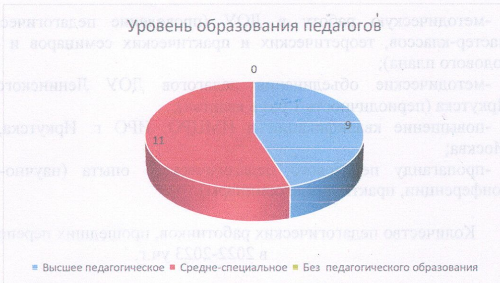
Рис.1. Уровень образования педагогов