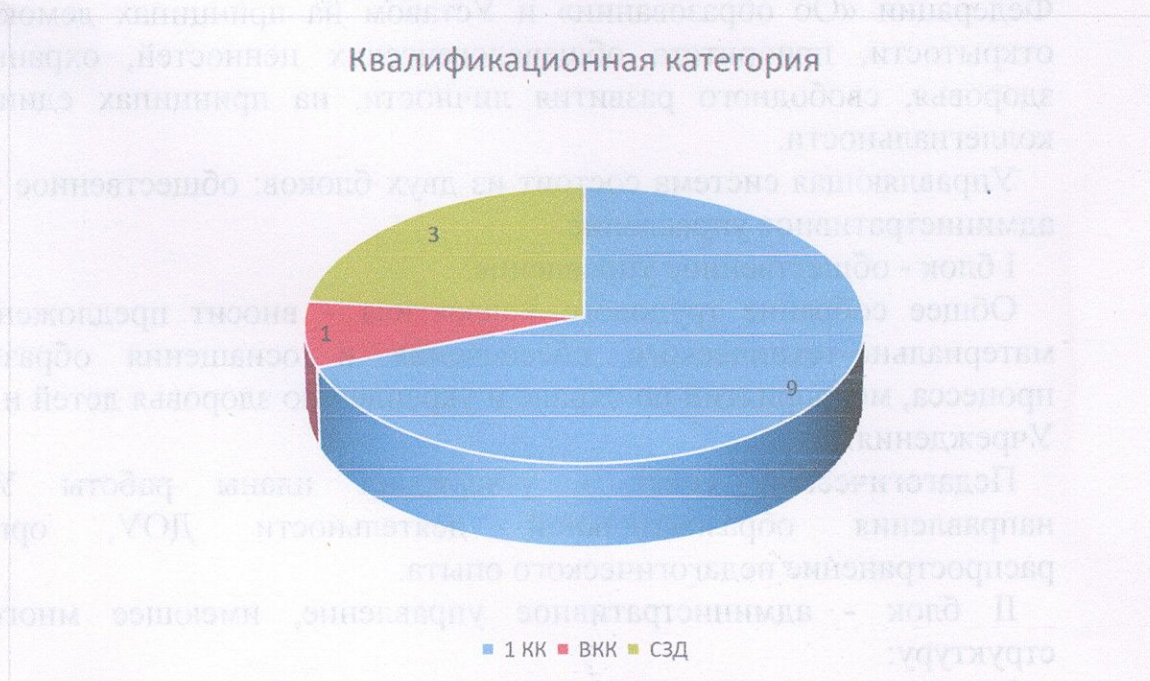
Рис.3. Категорийность педагогов

Из диаграммы следует, что 9 педагога имеют первую квалификационную категорию, и 1 – высшую квалификационную категорию, что составляет 50% от общего числа педагогов.