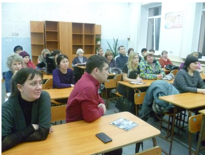
Родительское собрание «Не допустить беды»

Проведенная работа в рамках тематической недели дала положительные результаты в оздоровлении и формировании поведенческих навыков здорового образа жизни обучающихся.