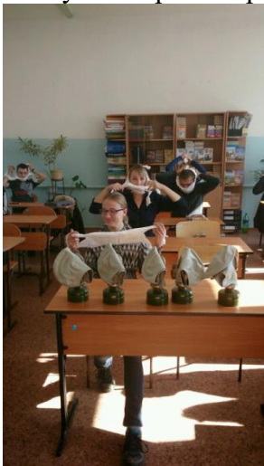
Учащиеся учатся оказывать неотложную помощь